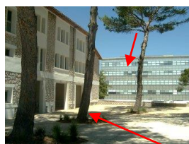
Bât G. Mégie – 1 er étage Collège Coopératif PAM