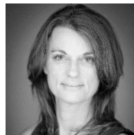
Table ronde n°3 « Dans quelle mesure les nouvelles modalités d'épargne et d'investissement peuvent-elles soutenir l'innovation »